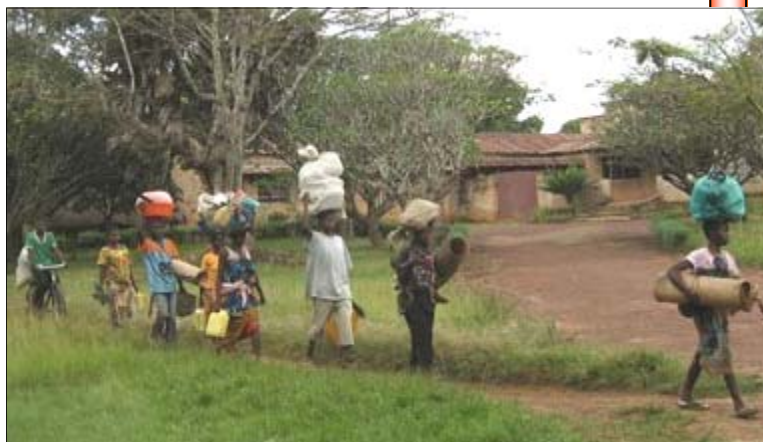
Sfollati nei pressi della missione Bamokandi (Dungu)